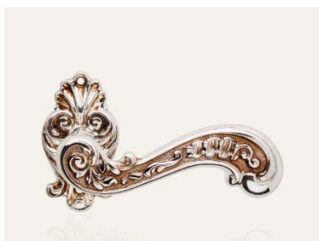
SB argento marrone silver brown