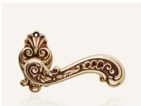
OF oro francese french gold