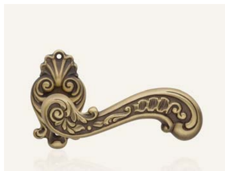
PM patiné patiné mat