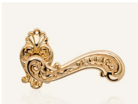
OZ oro zecchino gold plated