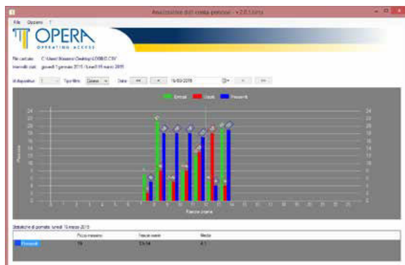
Analisi grafica giornaliera